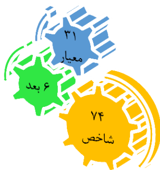
شکل ۳- شهر هوشمند